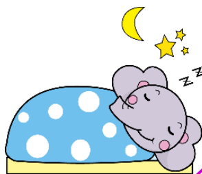
健康財団マスコットキャラクター けんぞうくん