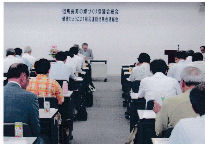
健康ひょうご21県民運動但馬会議総会の様子