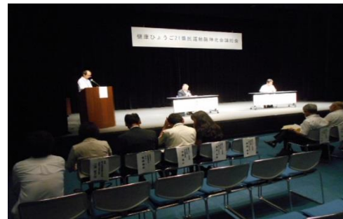
阪神北会議総会の様子