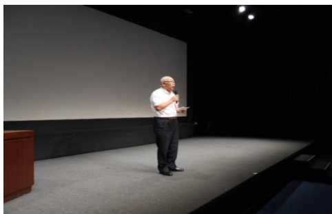
末岡副会長 閉会挨拶