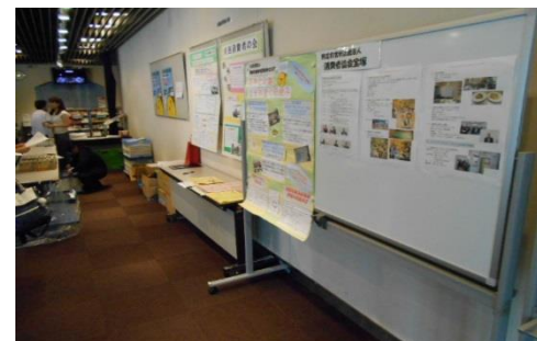
参画団体によるパネル展示