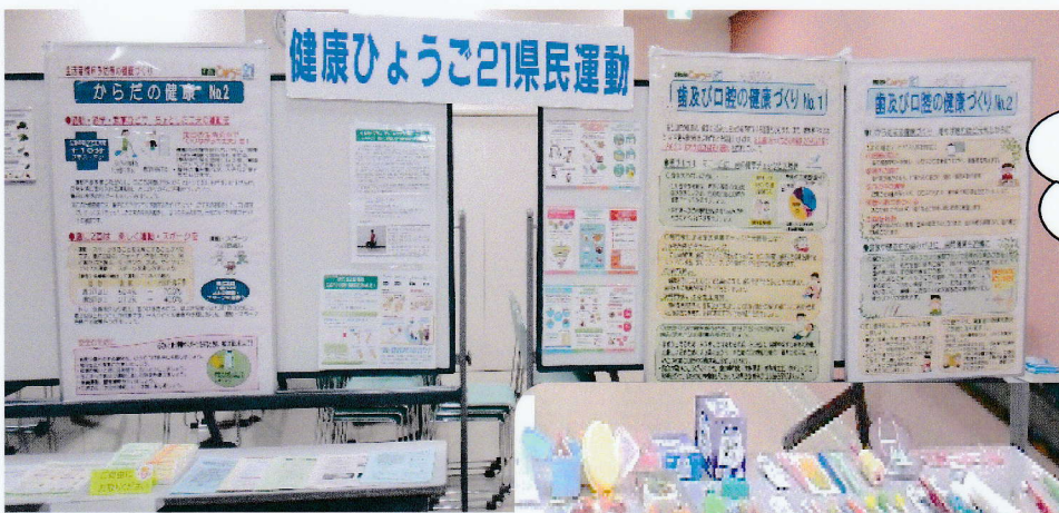
●パネル、リーフレット等展示