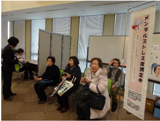
体験：ストレスチェック測定