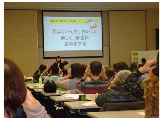
健口体操：兵庫県歯科衛生士会