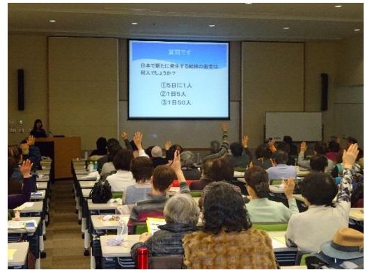
講話：結核・COPD の基礎知識