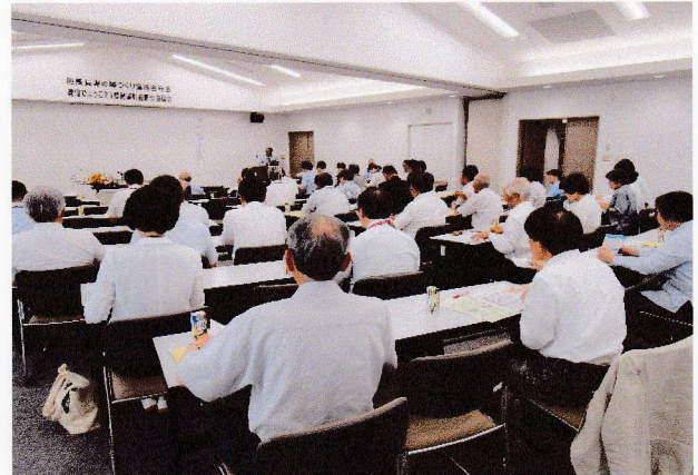
健康ひょうご21県民運動但馬会議総会の様子