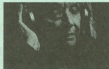
映画「パーソナル・ソング」の一場面