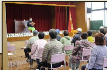
(上郡校区まちづくり推進委員会) (上郡町高年クラブ連合会) (すこやかクラブ)