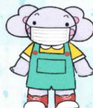
(公財)健康財団 マスコットキャラクター けんぞうくん