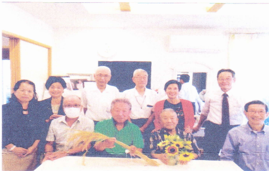
パレアナカフェ「令和3年9月25日」記念写真