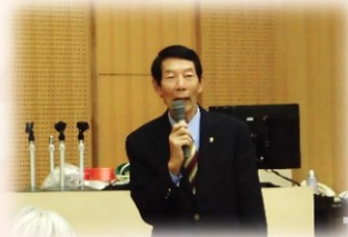
閉会あいさつ 中播磨会議 苦瓜 理事