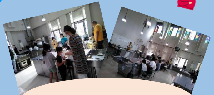
昨年のイベントの様子