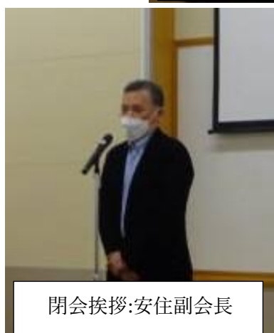
閉会挨拶:安住副会長